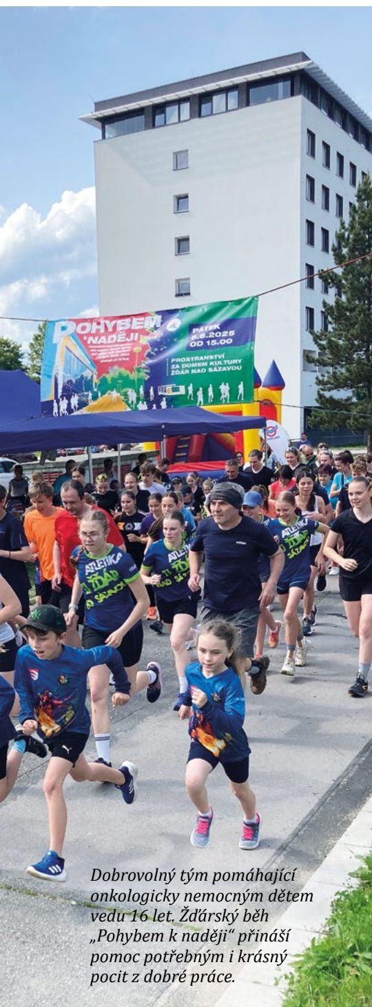
Dobrovolný tým pomáhající onkologicky nemocným dětem vedu 16 let. Žďárský běh „Pohybem k naději“ přináší pomoc potřebným i krásný pocit z dobré práce.

zastupovat při prosazování jejich potřeb. Často nejde jen o otázky jednoho obvodu, ale o témata, která se týkají celé společnosti. Proto se pravidelně setkávám se starosty a zajímám se o to, jaká témata a výzvy ve svých obcích aktuálně řeší. Se svými zkušenostmi z komunální politiky, v níž stále aktivně působím, nabízím radu a pomoc. Tak to mám v hlavě naprogramované. Plod mé práce není stavba nějakého „pomníku“, ale pocit radosti, když se povede společný záměr.