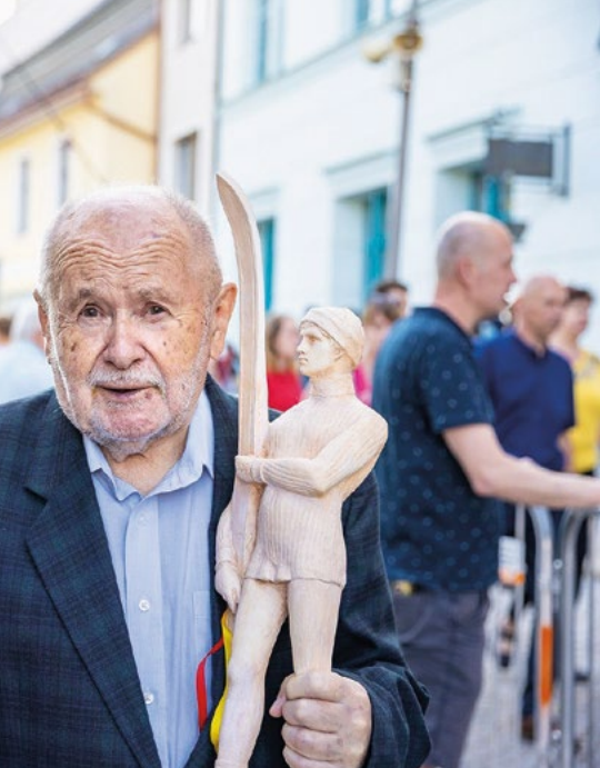
sportem v Novém Městě na Moravě.