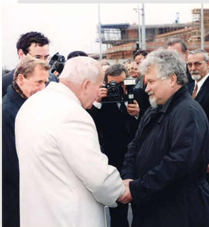
S papežem Janem Pavlem II. při jeho třetí návštěvě Česka, 1997.

Schůze vedení byly v úterý v sedm ráno v suterénu Charitasu. Přesně v osm byl konec, šlo se do práce. Přítomní byli členové předsednictva, ministři, náměstci