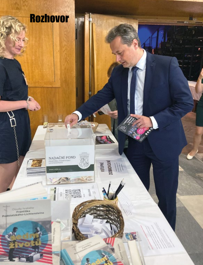
Přirozenou součástí mého života je pomáhat charitativním organizacím. Finančně, materiálně, dobrovolnictvím nebo přímou podporou.