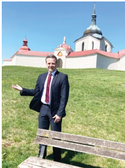
Před areálem kostela sv. Jana Nepomuckého na Zelené hoře ve Žďáře nad Sázavou.

Komunální politika je podle mě nejlepší cesta, jak získat kompetenci pro parlamentní práci.