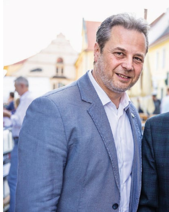
Oceňování významných osobností spjatých se Pan Rozhoň celý život upravoval běžecké tratě.

Parlamentní práce tvoří jen jednu část role senátora. Stejně důležité aspoň pro mě je být co nejvíc přítomen v regionu, naslouchat lidem a podle možností pomáhat řešit jejich problémy nebo je