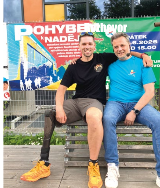
Běhu ve prospěch Nadačního fondu dětské onkologie Krtek se účastnilo přes 200 lidí. Hrdinové jsou všichni.

I když nejsem pedagog (ačkoli si to o mně řada kolegů myslí), mám k to-