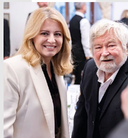
Se slovenskou exprezidentkou Zuzanou Čaputovou v Senátu, 2026.

Podporuju, aby si nový lídr k sobě – nediktátorsky! – stáhl vytváření kandidátek a personální politiku. Neokázalou přednost ať mají mladší a ženy. Moudrých starších je třeba si vážit. Pro „misijní území“ je třeba vytvořit jiné organizační členění. Musejí se svolávat a oceňovat naši starostové a radní. A jezdit, jezdit a znova jezdit po republice! Tehdy si lidé o lidoveckém lídrovi začnou říkat: To by byl dobrý premiér!