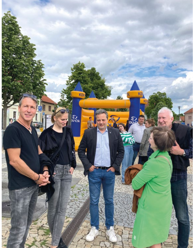
Lidovecké kontaktní kampaně na Vysočině mají švih, účastní se jich členové i sympatizanti KDU-ČSL napříč generacemi.