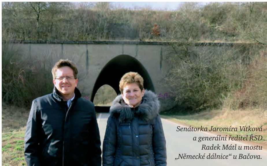
Senátorka Jaromíra Vítková a generální ředitel ŘSD Radek Mátl u mostu „Německé dálnice“ u Bačova.

■ V Poslanecké sněmovně leží ve schvalovacím procesu novela zákona o urychlení výstavby dopravní, vodní a energetické infrastruktury. Zkráceně tzv. liniový zákon. Cílem novely je rychlejší a efektivnější příprava dopravních staveb, zkrácení doby přípravy strategických dopravních staveb, zjednodušení povolenacích