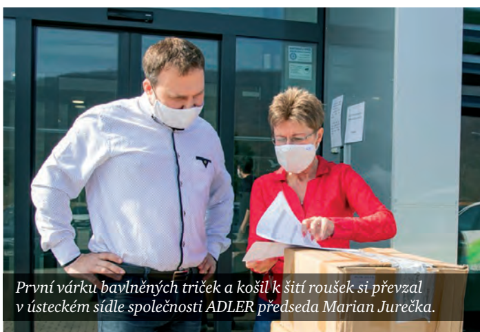
První várku bavlněných triček a košil k šití roušek si převzal v ústeckém sídle společnosti ADLER předseda Marian Jurečka.