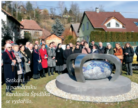
Setkání u památníku kardinála Špidlíka se vydařilo.

Autorka je zastupitelka KDU-ČSL v Boskovicích.