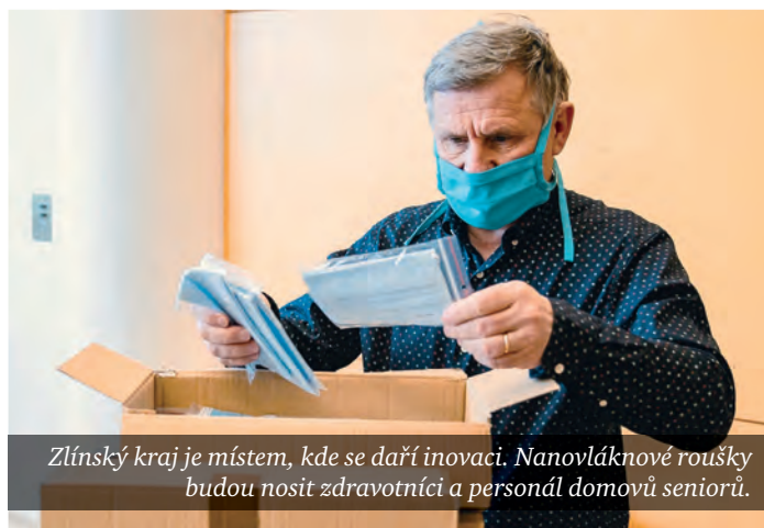
Zlínský kraj je místem, kde se daří inovaci. Nanovláknové roušky budou nosit zdravotníci a personál domovů seniorů.